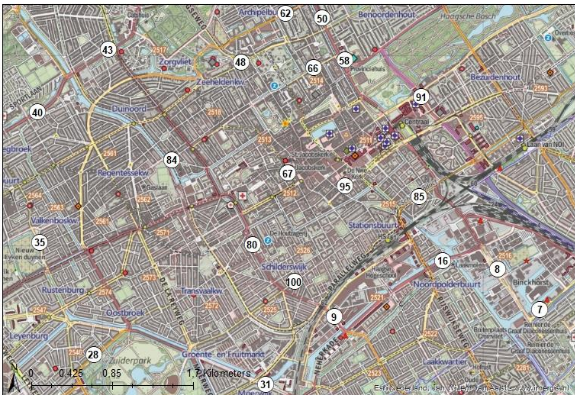
Figuur 1.2 Overzicht meetlocaties voor de NO 2 -concentraties in het centrum van Den Haag.